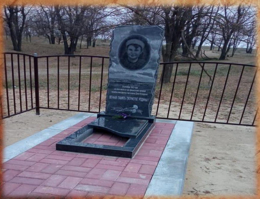
Обновлённый памятник на месте гибели Д. Кучеренко, 2021г.